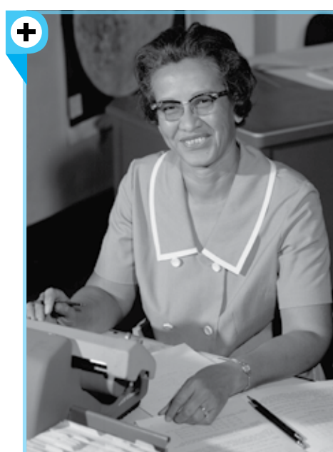
Em sentido horário, a americana Katherine Johnson, a austríaca Hedy Lamarr e a polonesa Marie Curie